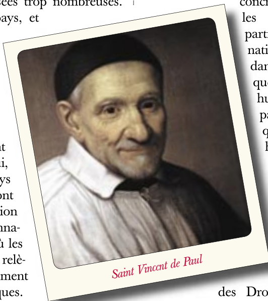
Saint Vincent de Paul

La Déclaration des Droits de l'Homme de 1789 ne s'affiche pas officiellement comme inspirée par le christianisme ; certains de ses auteurs s'affirment même comme des opposants au christianisme.